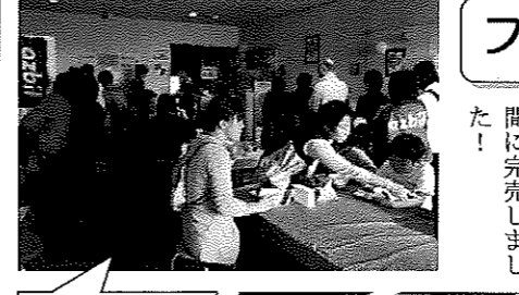
おしゃべりしたり、楽器を演奏したり、衣裳のままで一息...