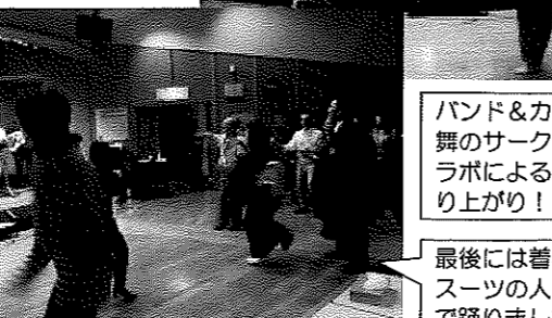
バンド&カラオケ&日舞のサークルの異色コラボによる発表に大盛り上がり!

普段同じ施設を利用していても、なかなかサークル同士が知り合いになるのは難しいもの。今回のフェスタをきっかけにサークル同士の交流がうまれるようにと交流会が行なわれました。館を利用しての全体的なサークルを対象としたこの会は、夜にもかかわらず、多くの方が参加しました。最初は緊張が見られましたが、歌って笑っておしゃべりして、終わるころには帰るのがおもしろいような、そんな気持ちになりました。