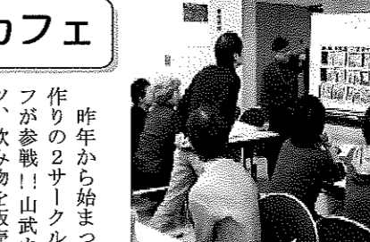
「開運学」の体験会の様子。皆さん真剣です...

日ごろのサークル活動をお客さんがミニ体験!!体験した方の中にはサークルに入会を希望する人も。サークルにとっても普段学んでいることを教えるという体験の場になりました。定員いっぱい、体験できない人が続出しました。