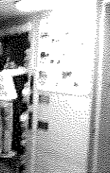
サークル会員の家族も設営の手伝い。フェスタを応援してくれた家族や友人のみなさん!ありがとうございました!!