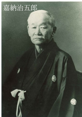
取材協力 公益財団法人講道館